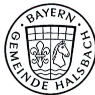
MARTIN POSCHNER Erster Bürgermeister