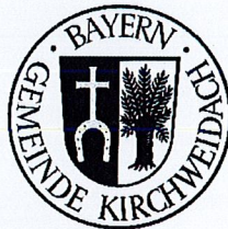
B. 11. ÄNDERUNG DES FLÄCHENNUTZUNGSPLANS